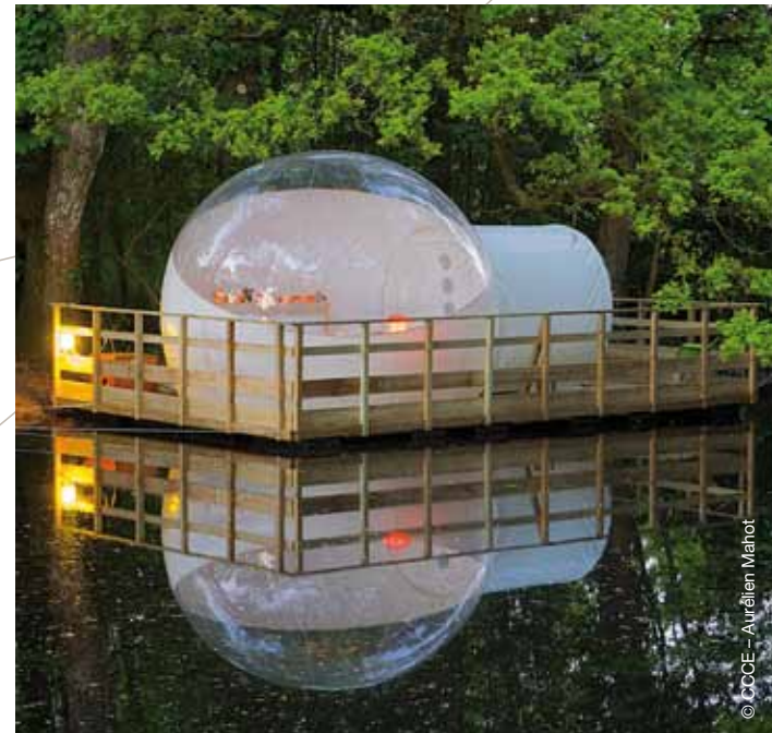
Bulle Flottante, Château de la Rousselière (Frossay)

En développant avec ses partenaires des prestations touristiques et culturelles (demi-journée, journée et séjour), la Plateforme de Découverte a pour vocation de « donner à découvrir et donner à comprendre » l'estuaire de la Loire. D'en révéler les facettes remarquables, entre rive nord et rive sud. Lancée après deux années d'expérimentation concluantes, elle propose des escapades à part, loin du quotidien.