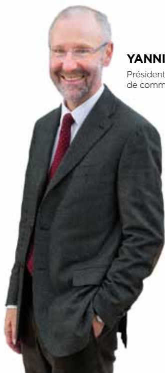
YANNICK HAURY Président de la communauté de communes Sud-Estuaire