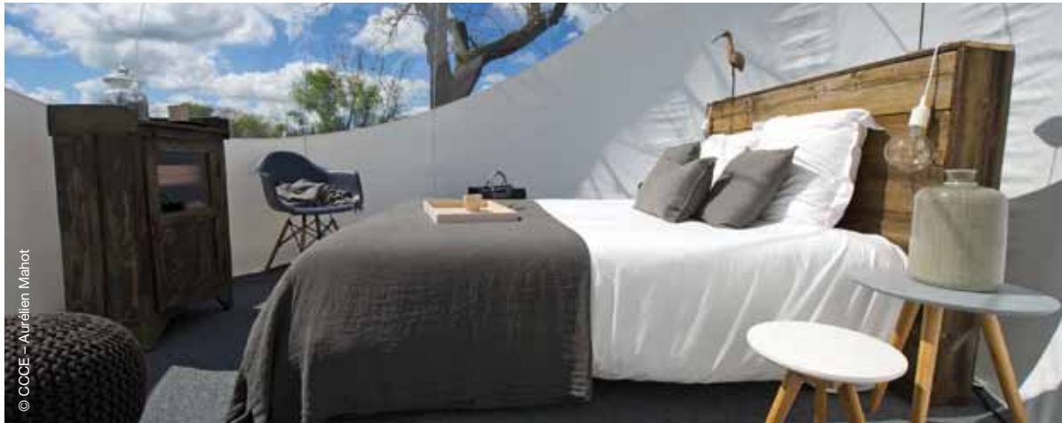
Bulle Lumière, Moulin de Chaugenêts (Saint Étienne de Montluc)

Dormir dans une bulle à ciel ouvert, embarquer pour une croisière inédite sur l'Estuaire... La Plateforme de Découverte Loirestua invite à de nouvelles expériences.